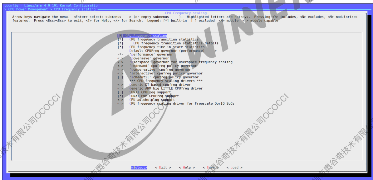
图 2-3: 配置图 3

对于 sun8iw18p1 这个没有使用标准 pwm regulator 驱动的平台：